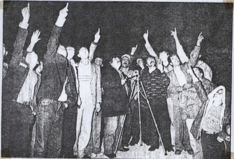
Picture 3: Residents of Aksaray are pointing out the luminous object in the sky.